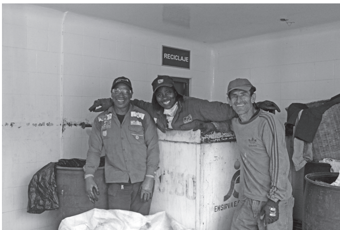
FOTO 17. OPERARIOS DE RECICLOPLAS

Fuente: Foto tomada por los investigadores en trabajo de campo, 2017.