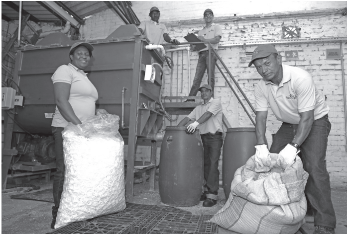
FOTO 16. RECICLADORES MICRORRUTA DE RECOLECCIÓN DE RESIDUOS EN UNIDADES RESIDENCIALES