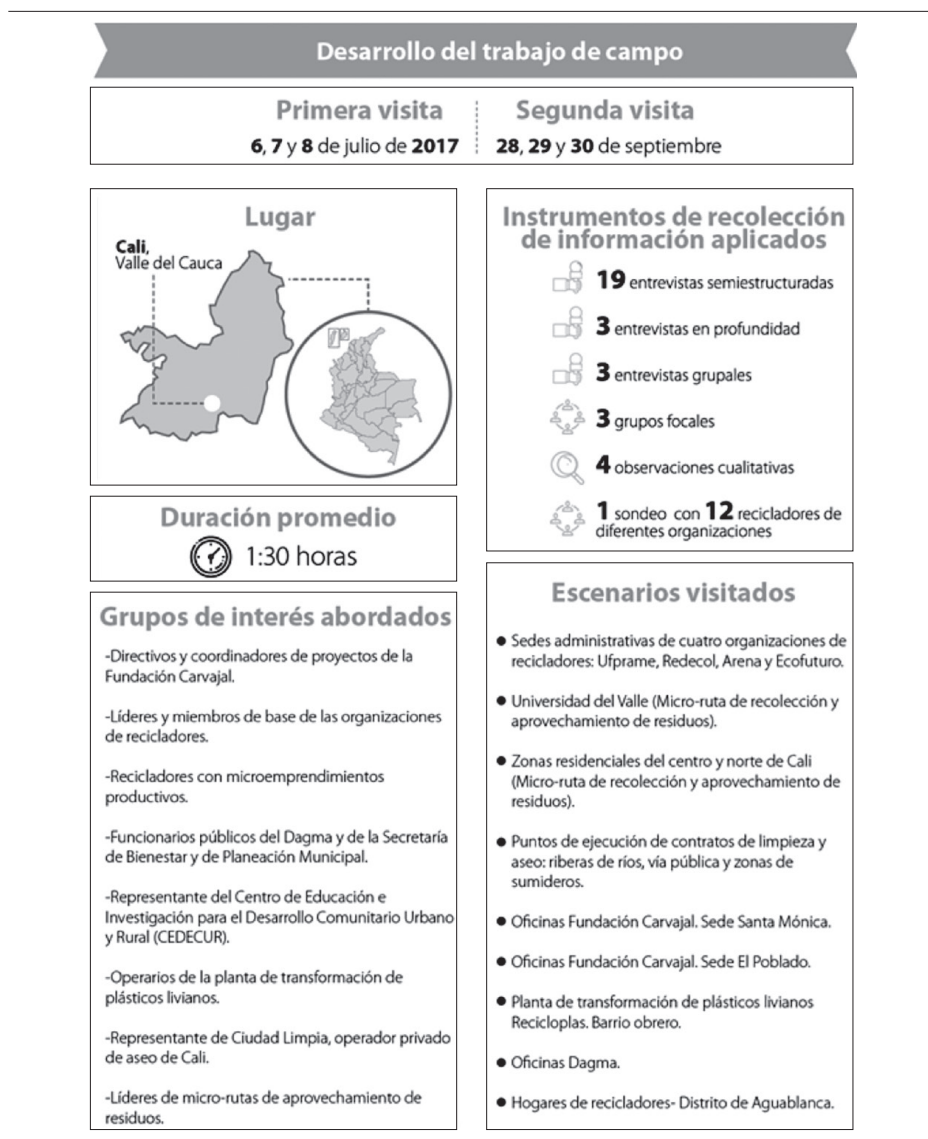
GRÁFICA 34. DESCRIPCIÓN PRINCIPALES COMPONENTES DEL TRABAJO DE CAMPO