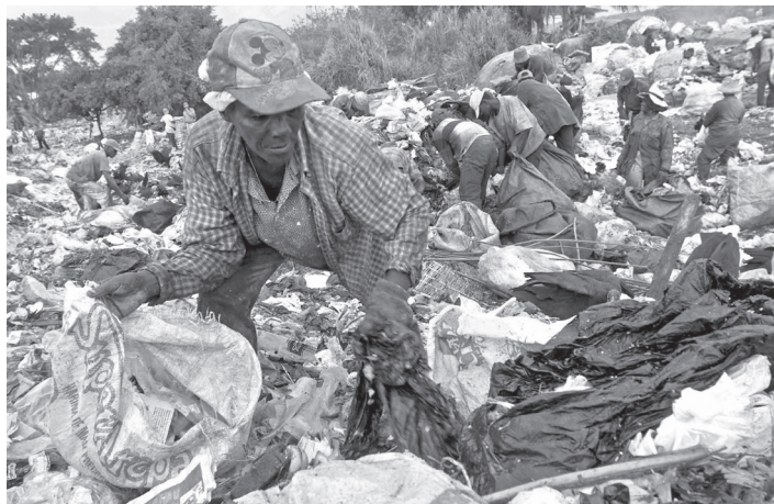
FOTO 15. CONDICIONES DE TRABAJO EN EL BASURERO DE NAVARRO