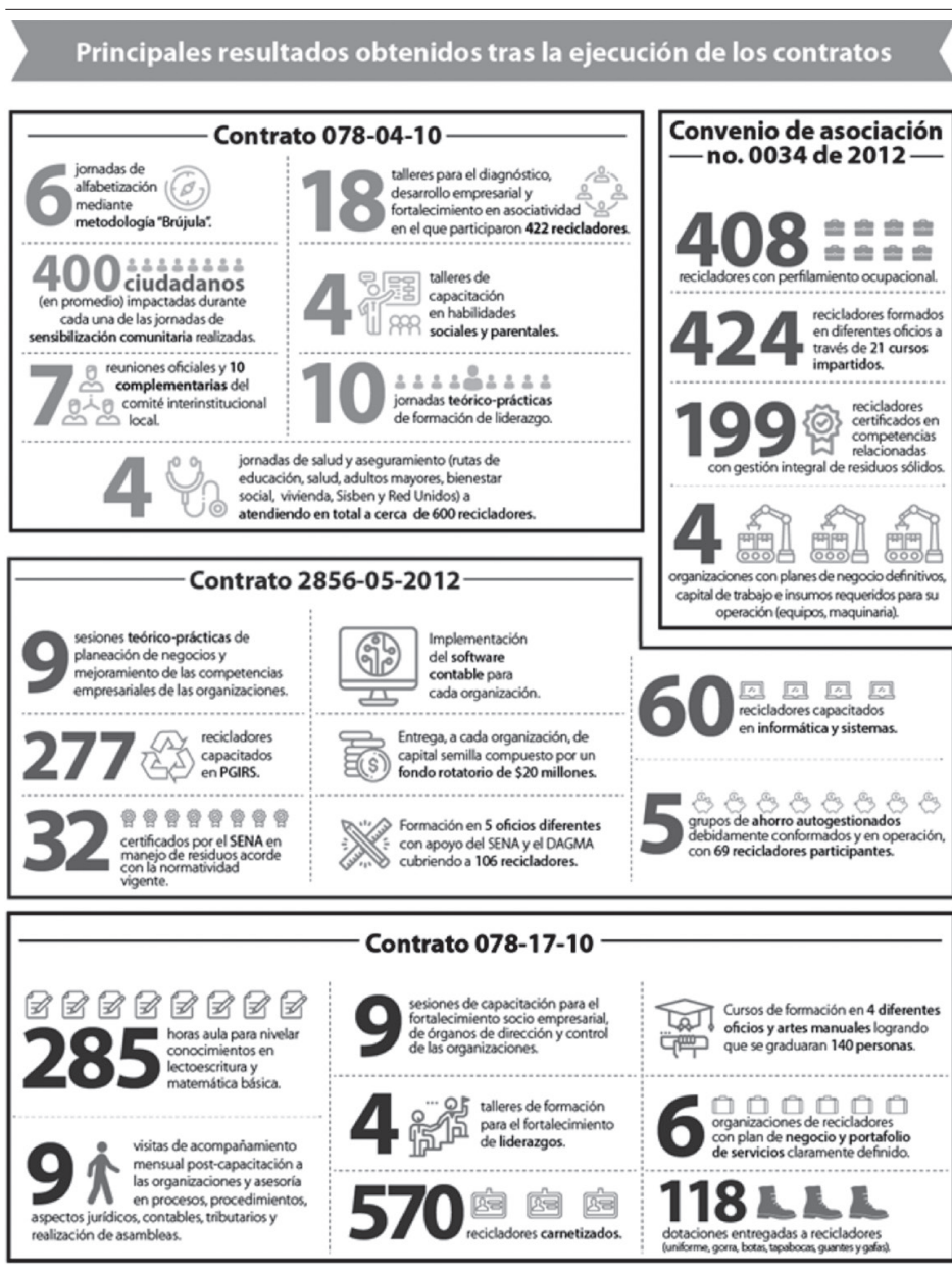
GRÁFICA 35. PRINCIPALES RESULTADOS DEL PROGRAMA